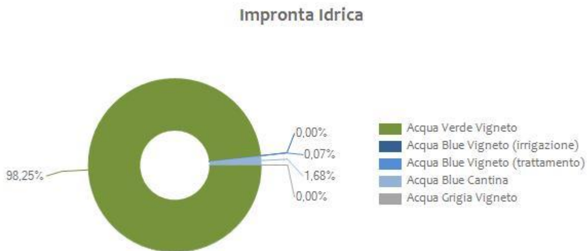
Figura 1 Valori percentuali dell'impronta idrica verde, blu e grigia.