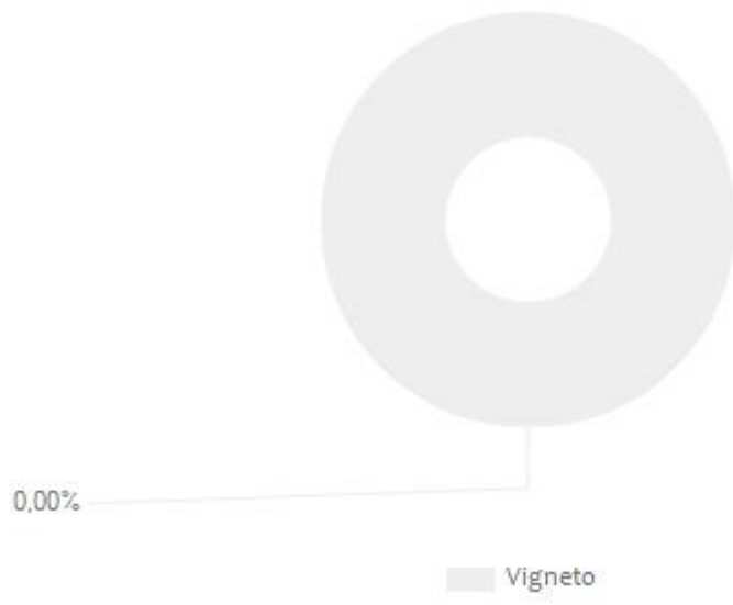
Figura 1. Valori percentuali dei diversi contributi rispetto a "Direct Water Scarcity Footprint" e "Non-Comprehensive Direct Water Degradation Footprint" TOTALI, per una bottiglia di Lambrusco Grasparossa Villa Cialdini.