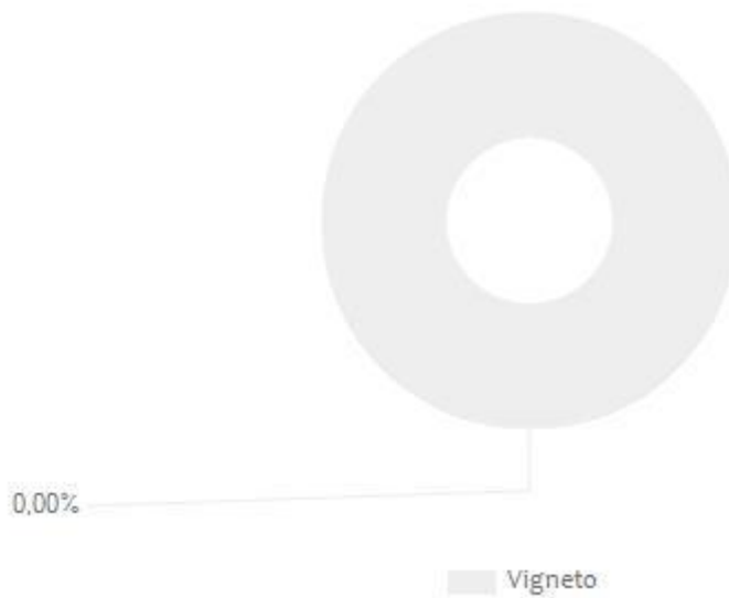
Figura 1. Valori percentuali dei diversi contributi rispetto a "Direct Water Scarcity Footprint" e "Non-Comprehensive Direct Water Degradation Footprint" TOTALI, per una bottiglia di Ribona della Famiglia.